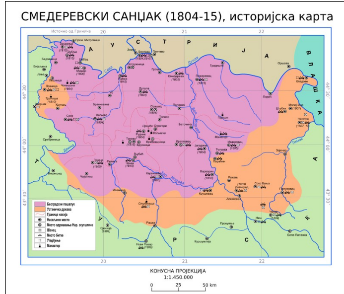
Територија ослобођена током Првог српског устанка