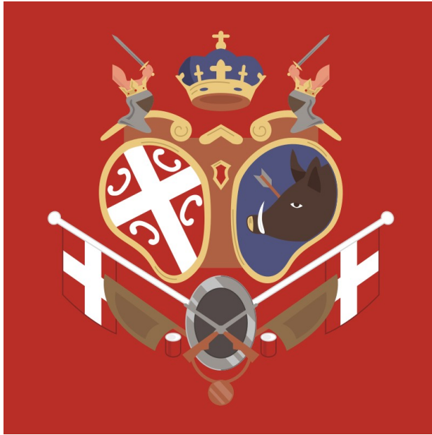
Српска застава из Првог српског устанка

Под појмом Српска револуција подразумевамо Први и Други српски устанак, јер се тим догађајима Срби нису само ослободили османске власти, већ су на простору Србије укинути турски феудални односи и почео је процес развоја буржоазије и грађанског друштва.